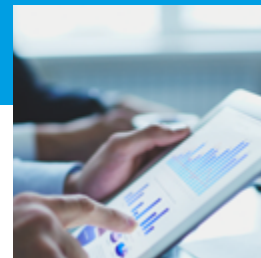
Gute Buchhaltung ist das A und O

Im Handelsbereich konnte der Werbemittelhandel aufgrund der Europawahl sowie einer Vielzahl von Kommunalwahlen im Umsatz deutliche Zuwächse verzeichnen und ein ausgeglichenes Ergebnis erzielen. Der Bereich Service umfasst Buchhaltungs- sowie IT-Dienstleistungen für den Unternehmensbereich sowie die SPD und lieferte einen gewohnt stabilen Ergebnisbeitrag.