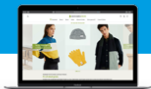
Der Onlinemarktplatz Avocadostore

Die Beteiligungen aus dem Bereich „nachhaltiger Konsum“ wachsen im Umsatz und im Ergebnis. So schließen die Avocado Store GmbH, Deutschlands größter Marktplatz für nachhaltige Produkte, und Utopia GmbH, Deutschlands führende Webseite für Kaufberatung rund um den nachhaltigen Lebensstil, das Berichtsjahr jeweils mit einem positiven operativen Ergebnis ab.