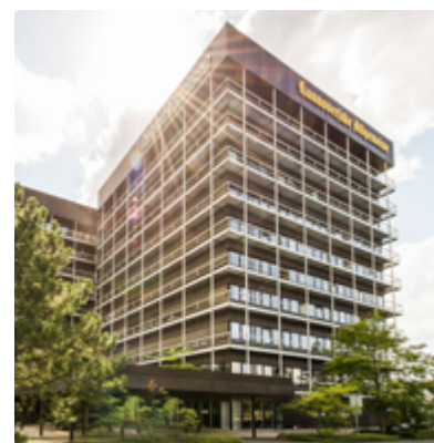
Das Verlagsgebäude des MADSACK Medien Campus

Die mittlerweile gewohnt hohen Ergebnisbeiträge aus dem Tourismus in den Vorjahren blieben im Geschäftsjahr aus. Wie bereits im vergangenen Jahr angedeutet, schlugen die Branchenprobleme auf der Veranstalterseite auch auf den Verkauf in den Beteiligungsunternehmen durch. Zudem konnten zwei Eigenveranstaltungen nicht so gut verkauft werden wie geplant. Insgesamt ist das Unternehmen mit einem blauen Auge davongekommen und schaffte noch ein ausgeglichenes Ergebnis.