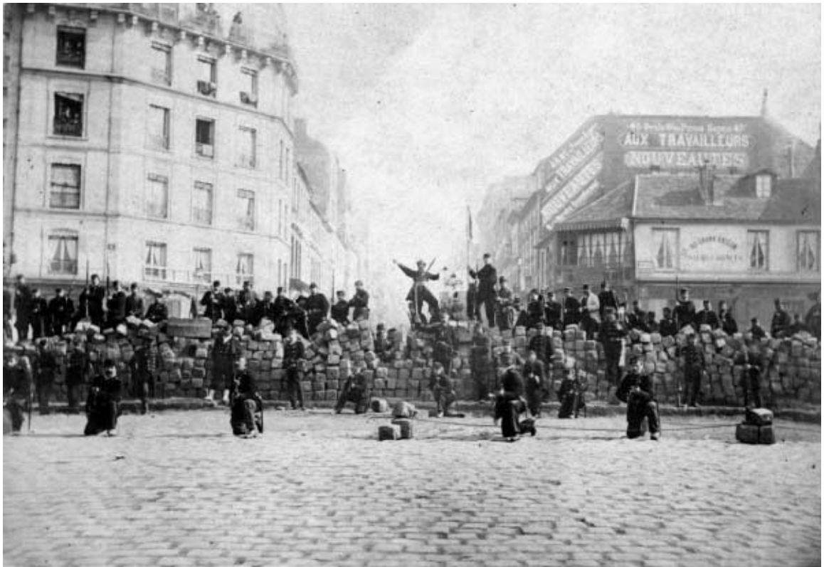
Eine frühe politische Vision, die zunächst blutig endete: Ausrufung der Pariser Kommune am 18. März 1871, Barricade de la Chaussee Menilmontan.