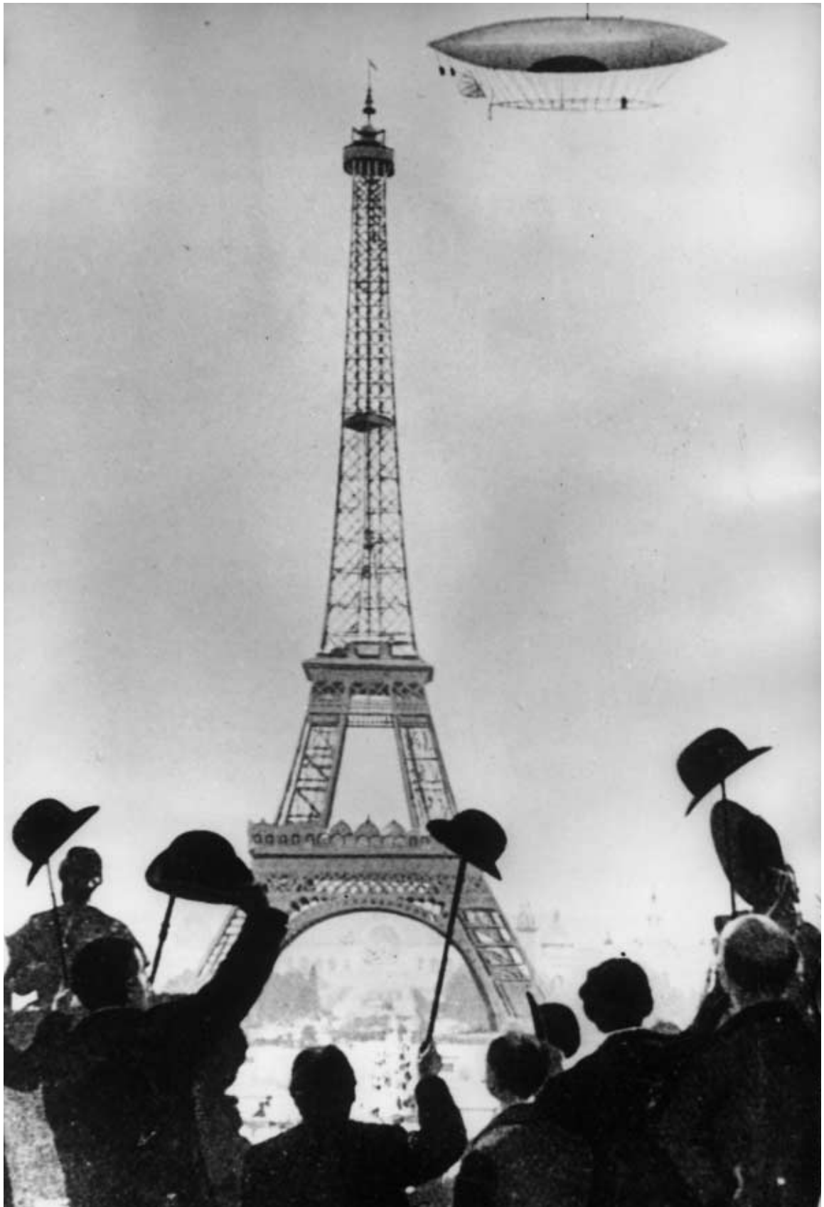
Euphorie des technischen Fortschritts: Der brasilianische Fluggpionier Alberto Santos-Dumont umfliegt mit seinem Luftschiff den Eiffelturm. Paris, 19. Oktober 1901.