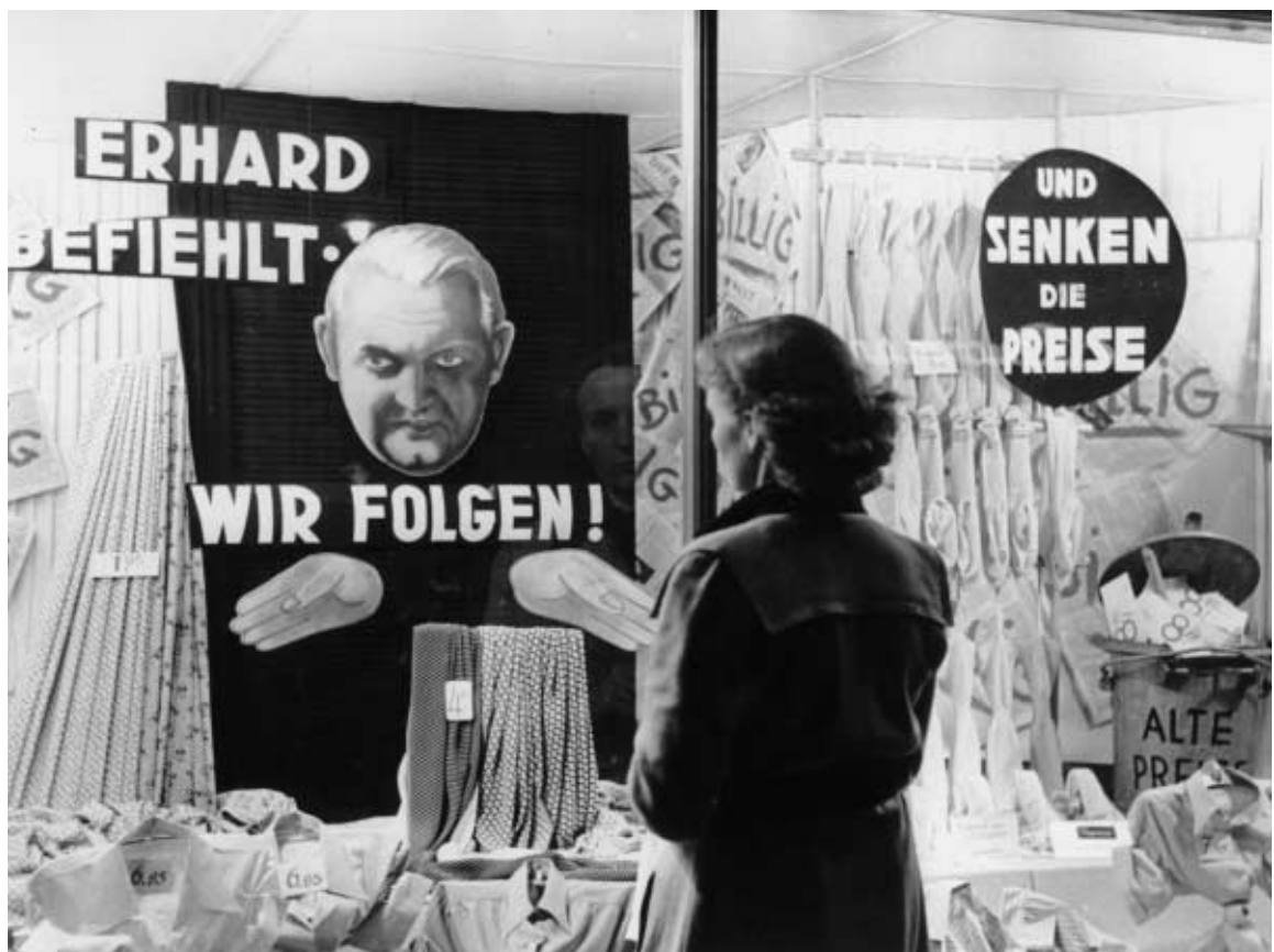
Ironie oder Einfalt? Wirtschaftsminister Ludwig Erhard, Vater des deutschen Wirtschaftswunders, als Schaufensterauslage eines Berliner Textilgeschäfts.