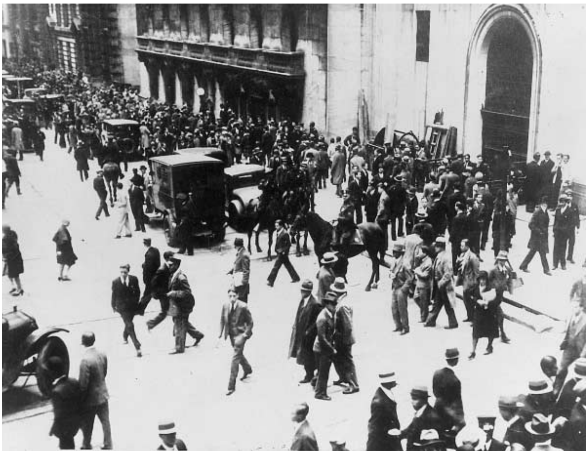
Das Ende der Euphorie. Zusammenbruch der Aktienkurse an der New Yorker Börse am 24. Oktober 1929, dem „Schwarzen Freitag“.