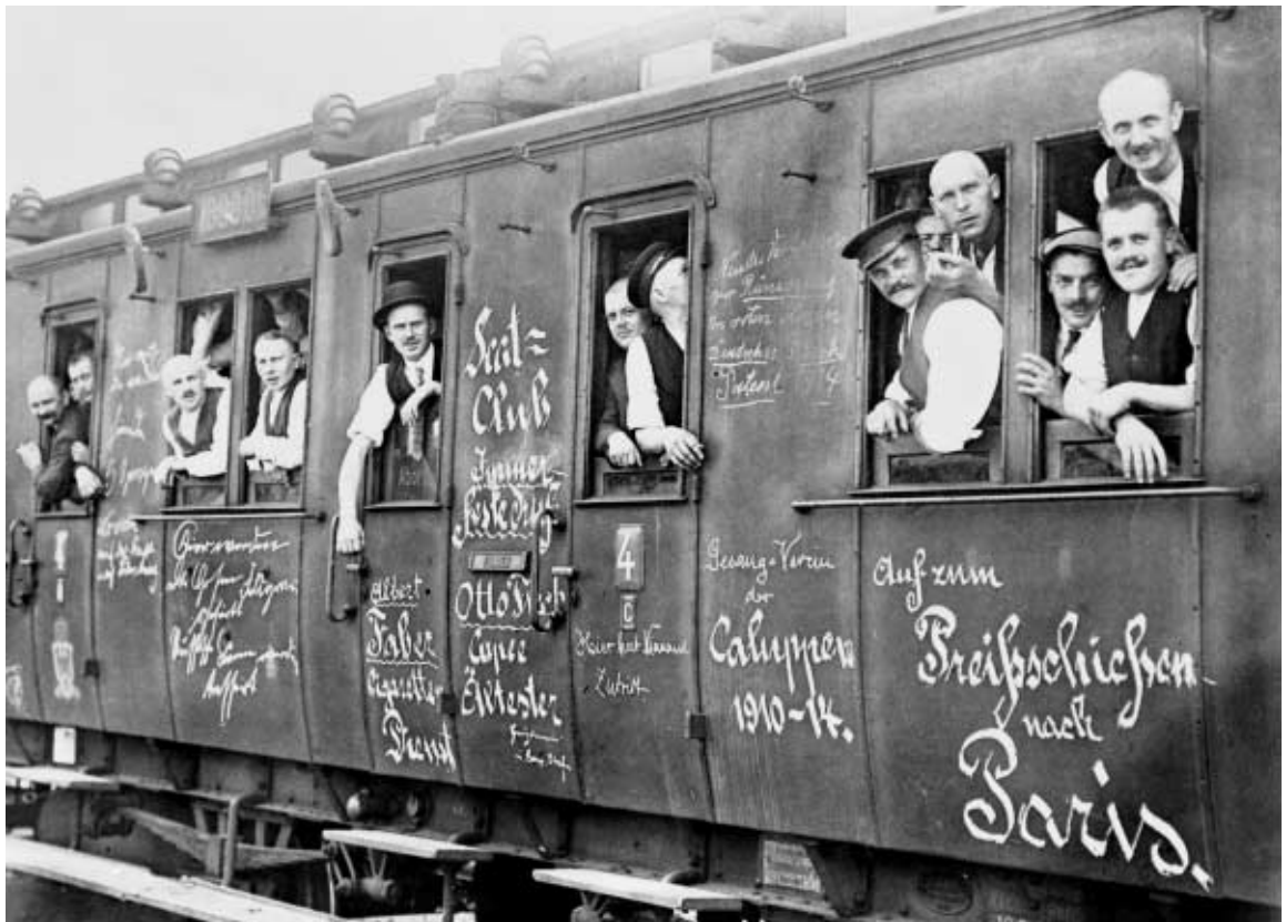
Mit Hurra in den Tod: Mobilmachung zum 1. Weltkrieg, Abfahrt eines Truppentransports auf einem Berliner Bahnhof am 28. August 1914.