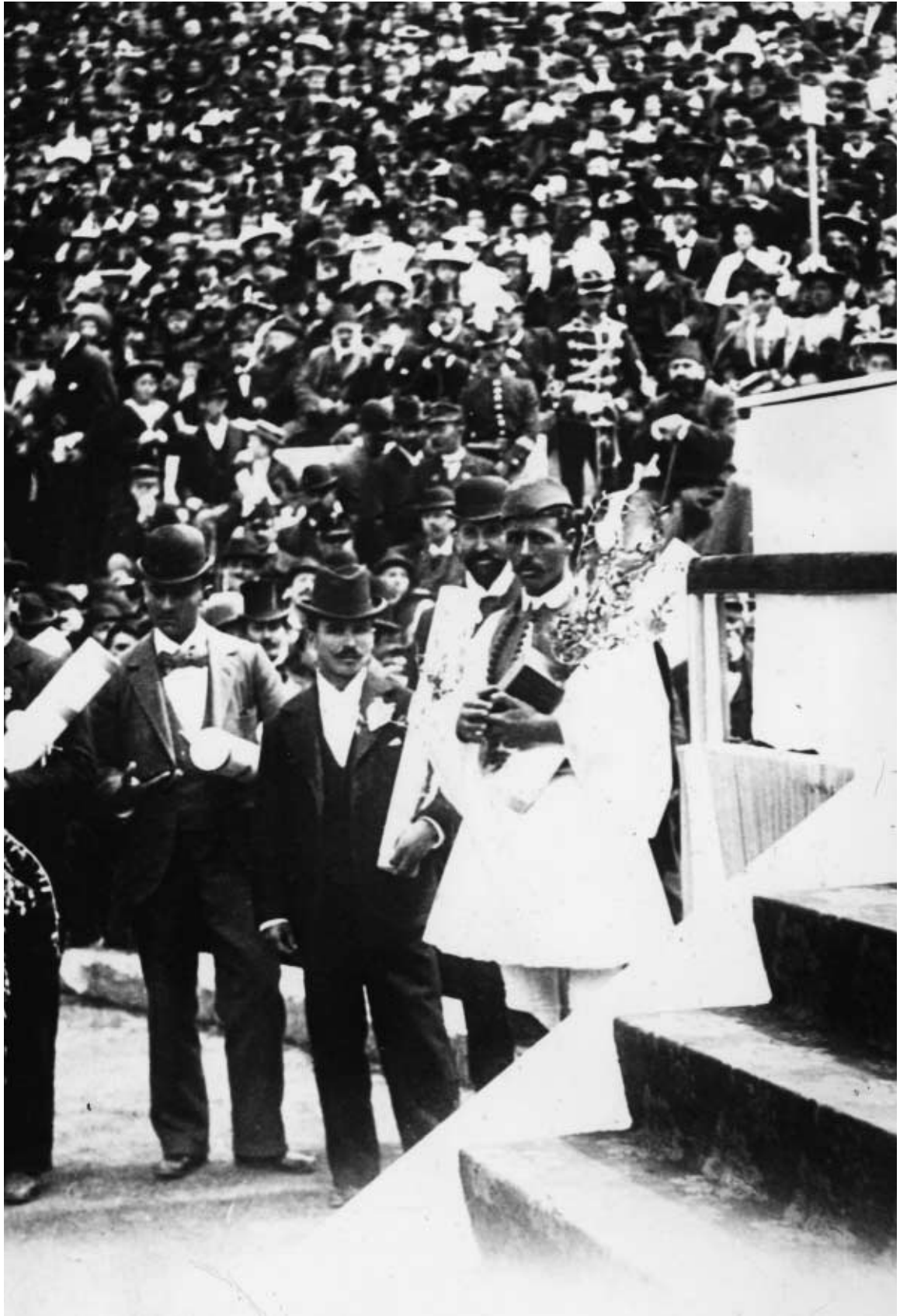
Der hoffnungsvolle Beginn einer neuer Ära der Völkerverständigung: Vom 6. bis 14. April 1896 finden in Athen die ersten Olympischen Spiele der Neuzeit statt. Drei Jahre später wird die Erste Haager Friedenskonferenz abgehalten.