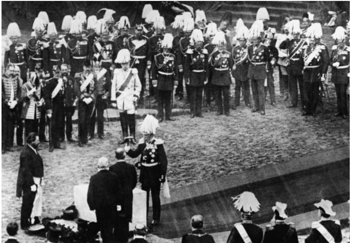
Der Reichstag, in guten wie in schlechten Zeiten ein Symbol für die Geschichte Deutschlands. Grundsteinlegung am 9. Juni 1884 in Gegenwart Wilhelm I., König von Preußen.