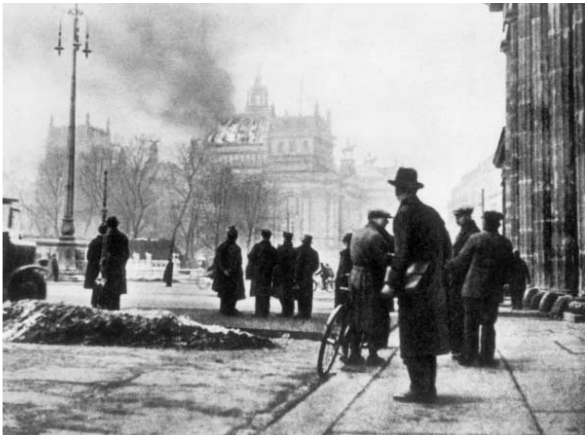
Ein Fanal der deutschen Geschichte: Reichstagsbrand 1933, Blick vom Brandenburger Tor auf das brennende Reichstagsgebäude am Morgen des 27. Februar.