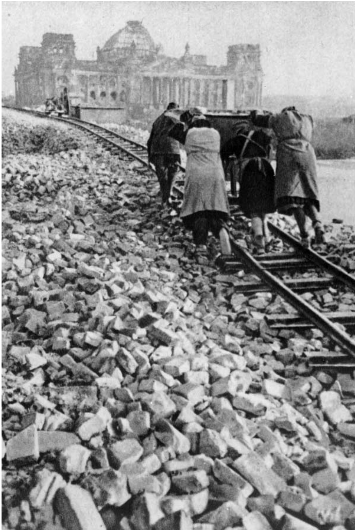
Symbolfiguren des Neubeginns aus den Ruinen: „Trümmerfrauen“ auf dem Gelände vor dem Berliner Reichstag, 14. Januar 1946.