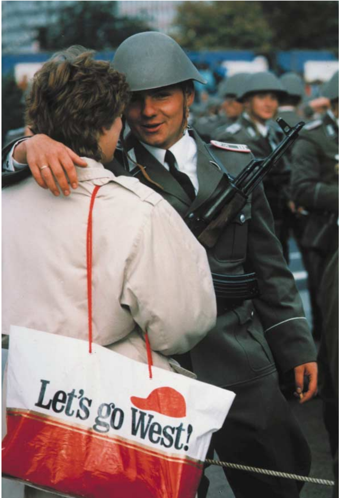
Berlin, Brandenburger Tor, 31.12.1989: Ein Land wächst zusammen, ein System zerfällt. Ein Wendepunkt nicht nur der Geschichte Deutschlands, sondern der ganzen Welt.